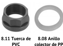
8.11 Tuerca de PVC